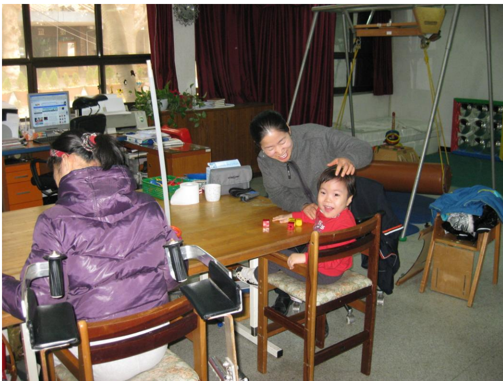
Aktivering af nogle af Ilsans beboere

Holts Goyang-City Community Service Center fungerer som et medborgerhus, hvor der tilbydes en række aktiviteter særligt for handicappede, men også for andre beboere i området. I forbindelse med centret blev der den 1. november 2010 åbnet en