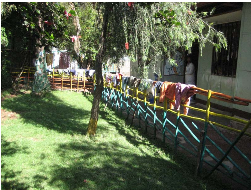
Billede fra Sele Enat Mahiber

Sele Enat Mahiber havde tre programmer, hvoraf børnehjemmet udgjorde det ene program. Den anden del af programmet var rettet mod mødrene, hvor institutionen yder økonomisk støtte til ét barns uddannelse og leveomkostninger samtidig med, at moderen får muligheden for at tage en uddannelse. Det tredje program udgør hovedparten af organisationens virksomhed og består af et sponsorprogram for børn over 6 år. I øjeblikket er der 18 børn involveret i programmet. Børnene modtager penge til tøj og mad. De børn, der udvælges til programmet, er oftest børn af arbejdsløse eller enlige forældre. For at kunne blive i programmet skal børnene passe