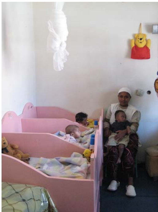
Billede fra spædbørnsstue på Enat Alem

Begge hjem bestod af flere bygninger. Udover barneplejersker var der til de to hjem tilknyttet 7 sygeplejersker, 2 psykologer og 2 læger. I bygningerne for de mindre børn var mulighed for, at børnene kunne komme ud på gulvet og lege på et tæppe. På afdelingen for de større børn virkede børnene generelt glade. Nogle af børnene var meget kontaktsøgende.