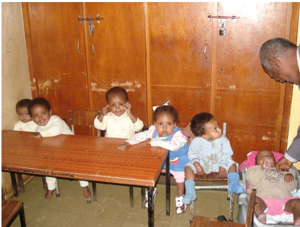
Billede fra spisesalen på Kebebe Tshai

Af de børnehjem delegationen besøgte var Kebebe Tshai det børnehjem, som havde de dårligste fysiske rammer. Børnehjemets leder og personale fremstod engagerede og imødekommende over for børnene.