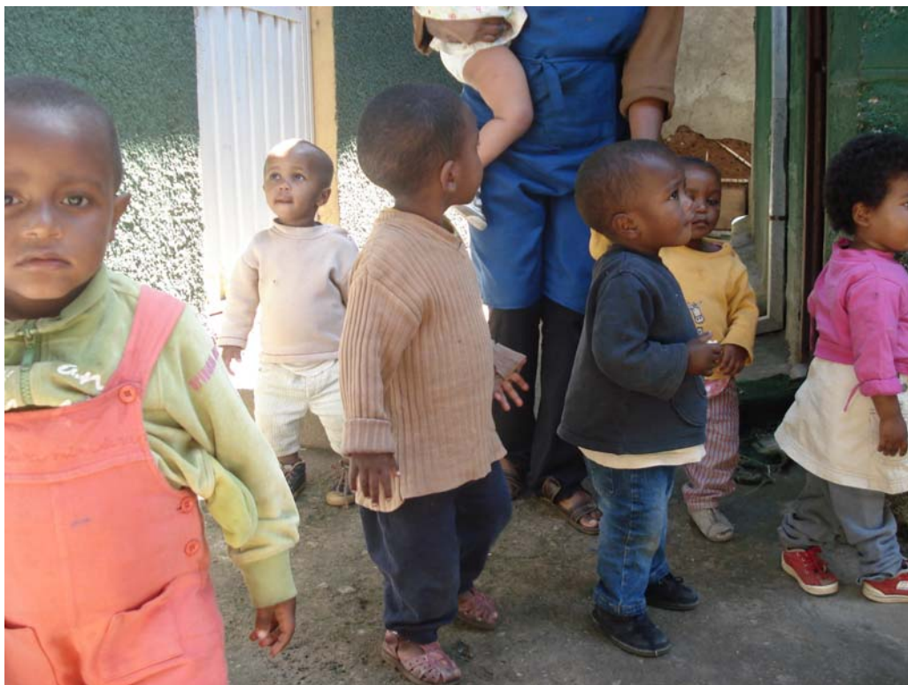
Billede fra udendørsareal på Almaz

Børnene virkede overvejende til at trives og udviste en naturlig reservation over for delegationen. Personalet virkede venligt og engageret i børnenes ve og vel.