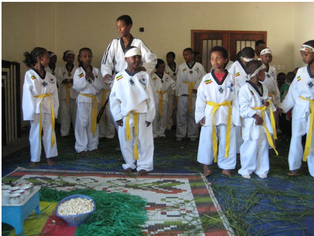
Billede fra Taekwondo- opvisning på Enat Alem.