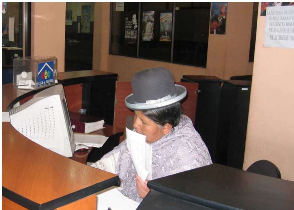
Billede af receptionsdisk i Viceministeriet

Endelig orienterede Viceministeriet om, at der ikke fandtes et centralt tilsyn med børnehjemmene, men at dette formentlig ville blive ændret i forbindelse med de nye retningslinjer, som aktuelt var under udarbejdelse. Klager over et børnehjems virksomhed vil skulle indbringes for præfekturaen, som er overordnet i forhold til børnehjemslederne.