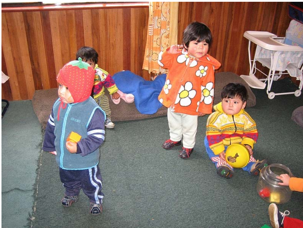
Billede fra børnehjemmets stue for 1-4 årige børn.

Hjemmet fokuserer på at skabe så familielignende forhold som muligt.