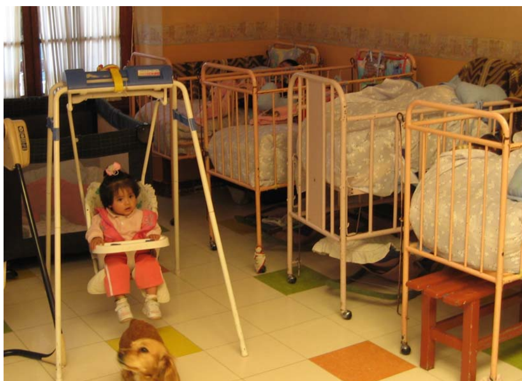
Billede fra en af stuerne på børnehjemmet.

Vi hørte ikke om hyppigheden af infektioner, f.eks. luftvejsinfektioner. (Der er ganske koldt og tilsyneladende ringe opvarmningsmuligheder i børnehjemmet). I lægens konsultationsrum, som set i forhold til det lokalt forventelige virkede ordentligt, rent og hygiejnisk, var der tillige faciliteter til tandlægebehandling og børnehjemmet havde tilknyttet tandlæge.