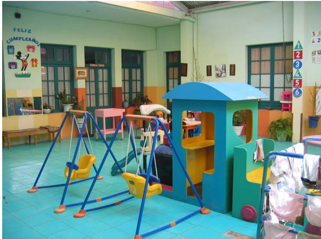
Billede af det fælles legeområde på børnehjemmet.

De store kan bevæge sig uden for børnehjemmet. De har et socialt liv og får lomme penge, som de kan bruge til f.eks. at gå i biografen.